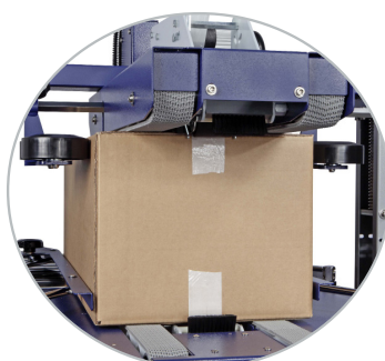
Topp- och sidodrivna bandtransportör